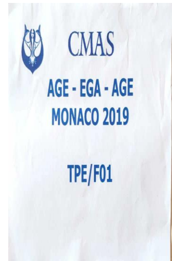
說明：2019 年世界水中運動聯盟會員大會中華台北代表及議程