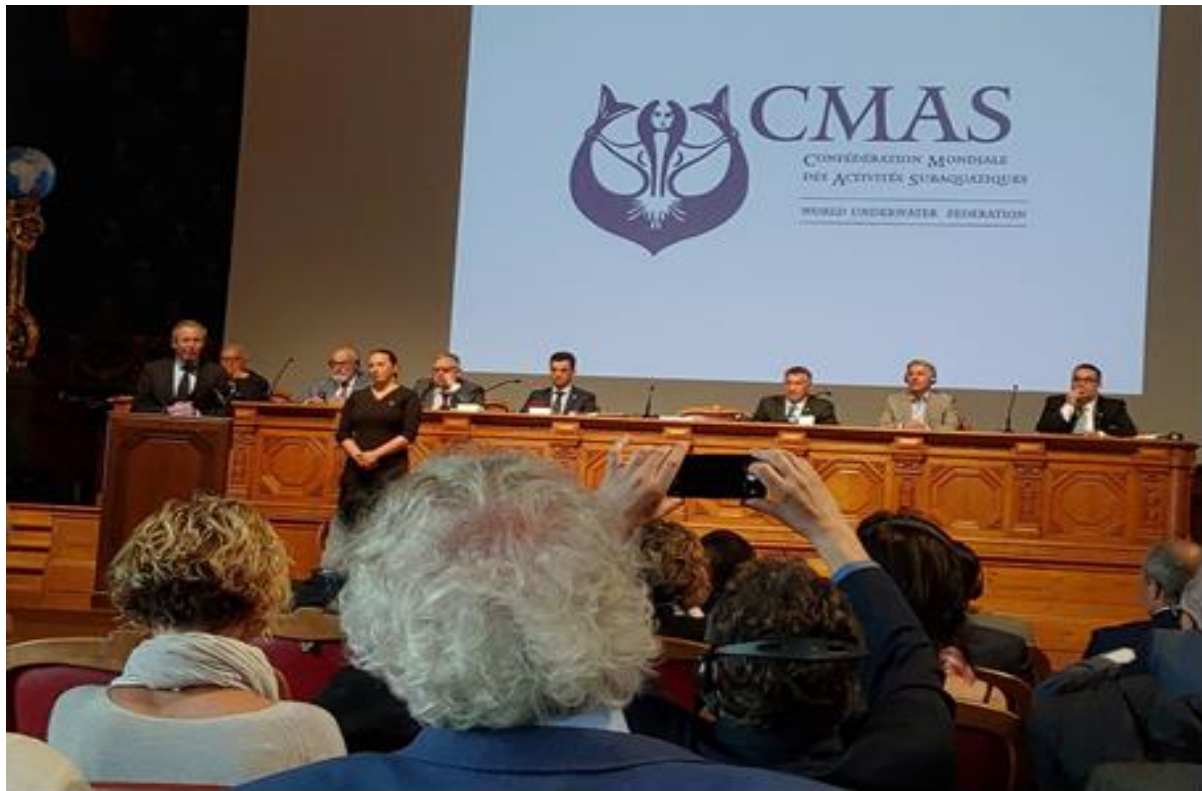
說明：總會主席致詞