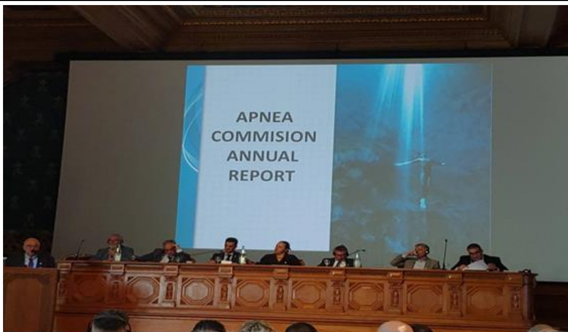
說明：運動委員會報告