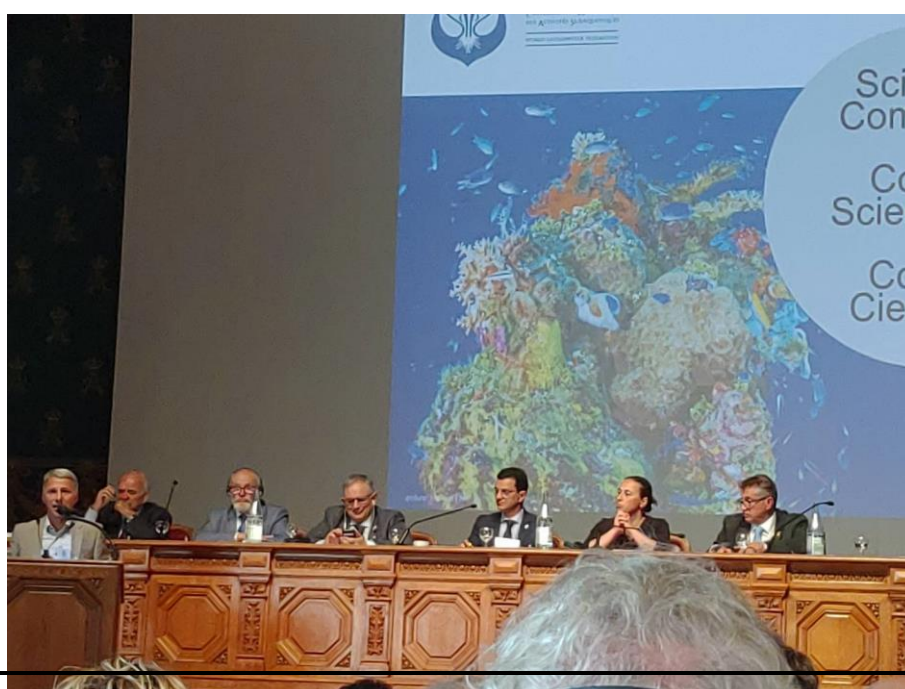
說明：科學委員會主席報告