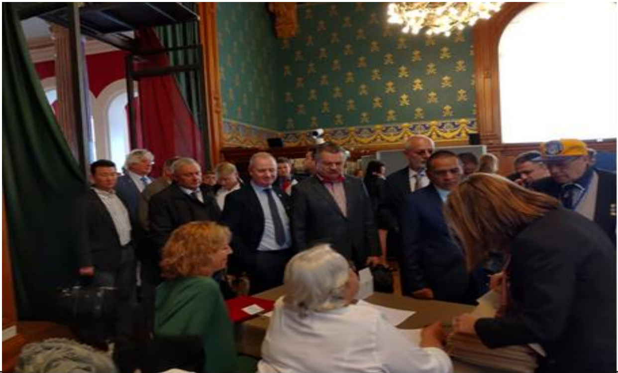
說明：2019 年世界水中運動聯盟會員大會各國代表報到