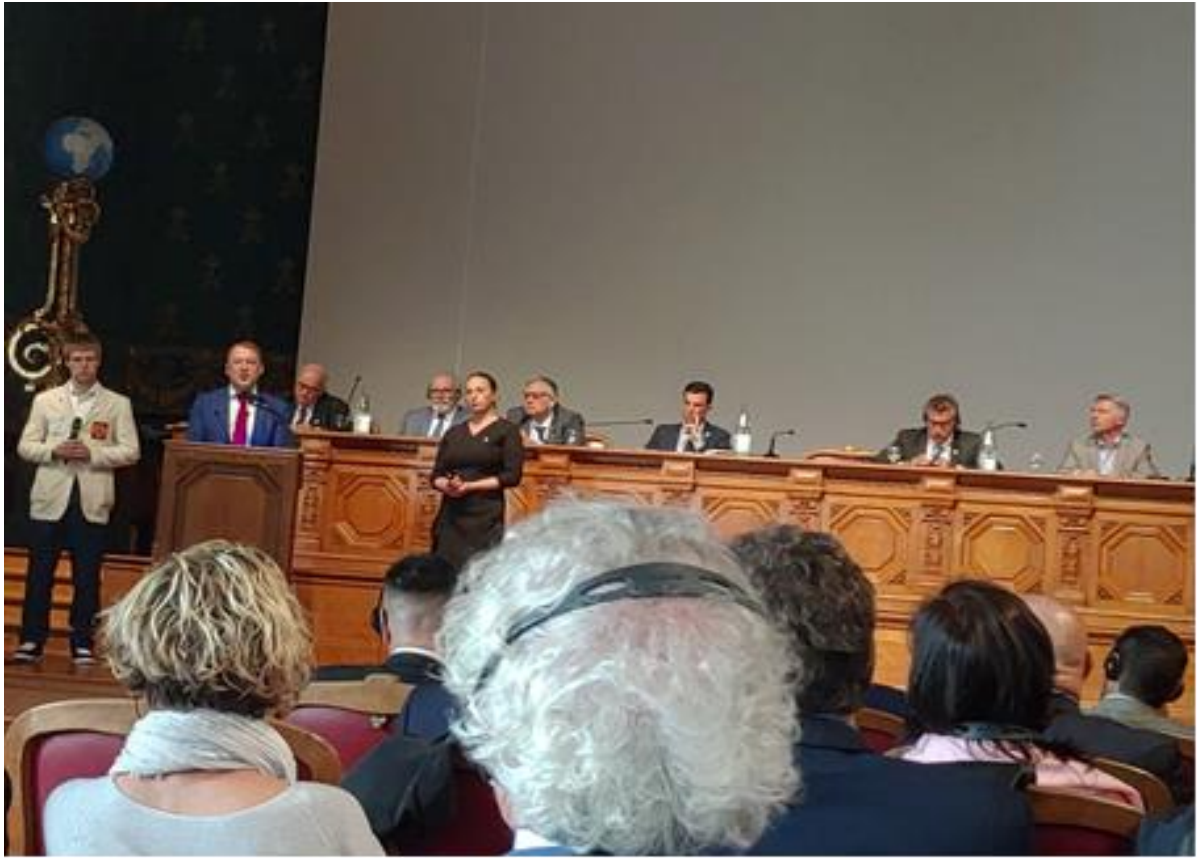
說明：俄羅斯副市長介紹世錦賽場域