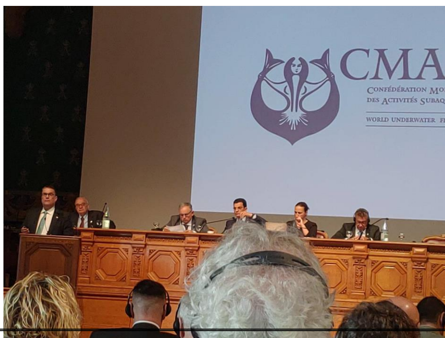
說明：技術委員會報告