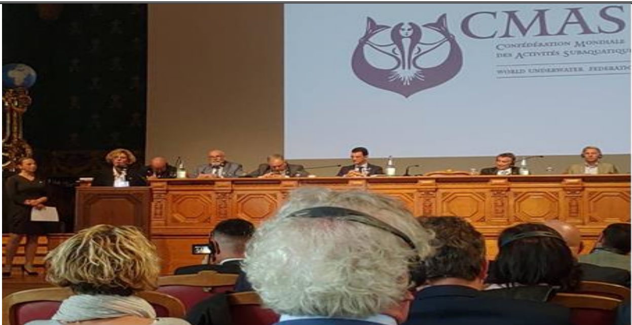
說明：比利時潛水與運動委員會長介紹該會發展前瞻性