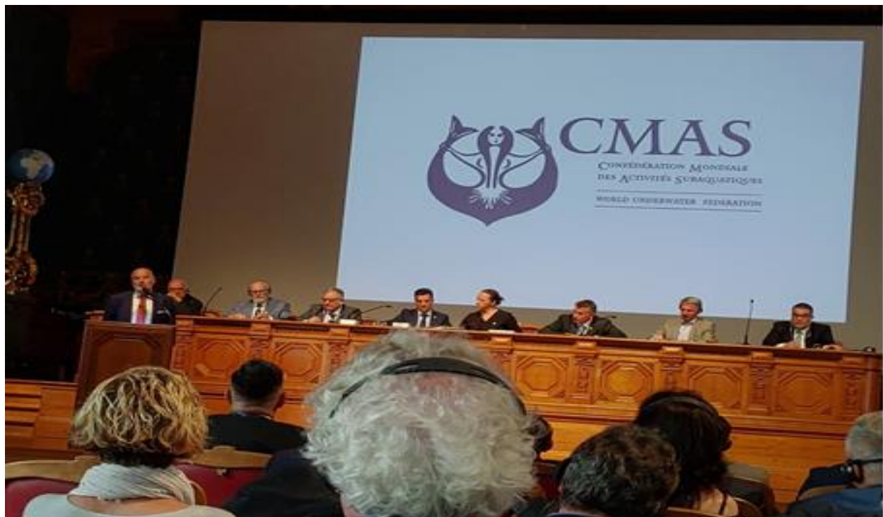
說明：摩納哥海洋博物館館長致歡迎詞